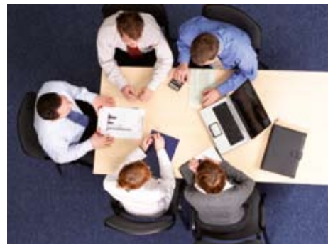
Praktische Erfahrung vermittelt das Frieters Schulungszentrum

Mit dem Frieters-Vertriebspartnerprogramm werden neue Qualifikations-Maßstäbe gesetzt. Unser Schulungszentrum bietet ein breitgefächertes Angebot auf Basis der Produkte und Systeme an Absauganlagen.