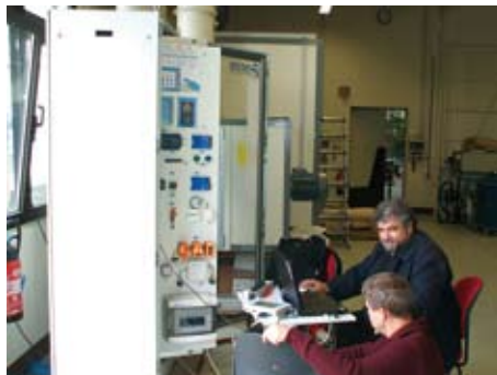
Ressourcen nutzen durch Anmietung qualifizierter Fachkräfte

Eine Festpreisvereinbarung oder Abrechnung auf Stundenbasis machen Arbeitskosten kalkulierbar.